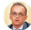
HEIKO MAAS MINISTRO ALEMÁN DE ASUNTOS EXTERIORES