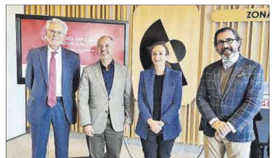
Presentación ayer del estudio del ICJC en Zona Franca.

Las empresas auditadas no solo tienen mejores resultados y menor deuda, sino que son más longevas. Por ello, ha animado a las firmas que todavía no lo hacen, a que se sometan a auditorías, incluso aunque no estén obligadas, porque eso redundará en un aumento de la confianza no solo de los agentes económicos e inversores, sino también de sus propios empleados.