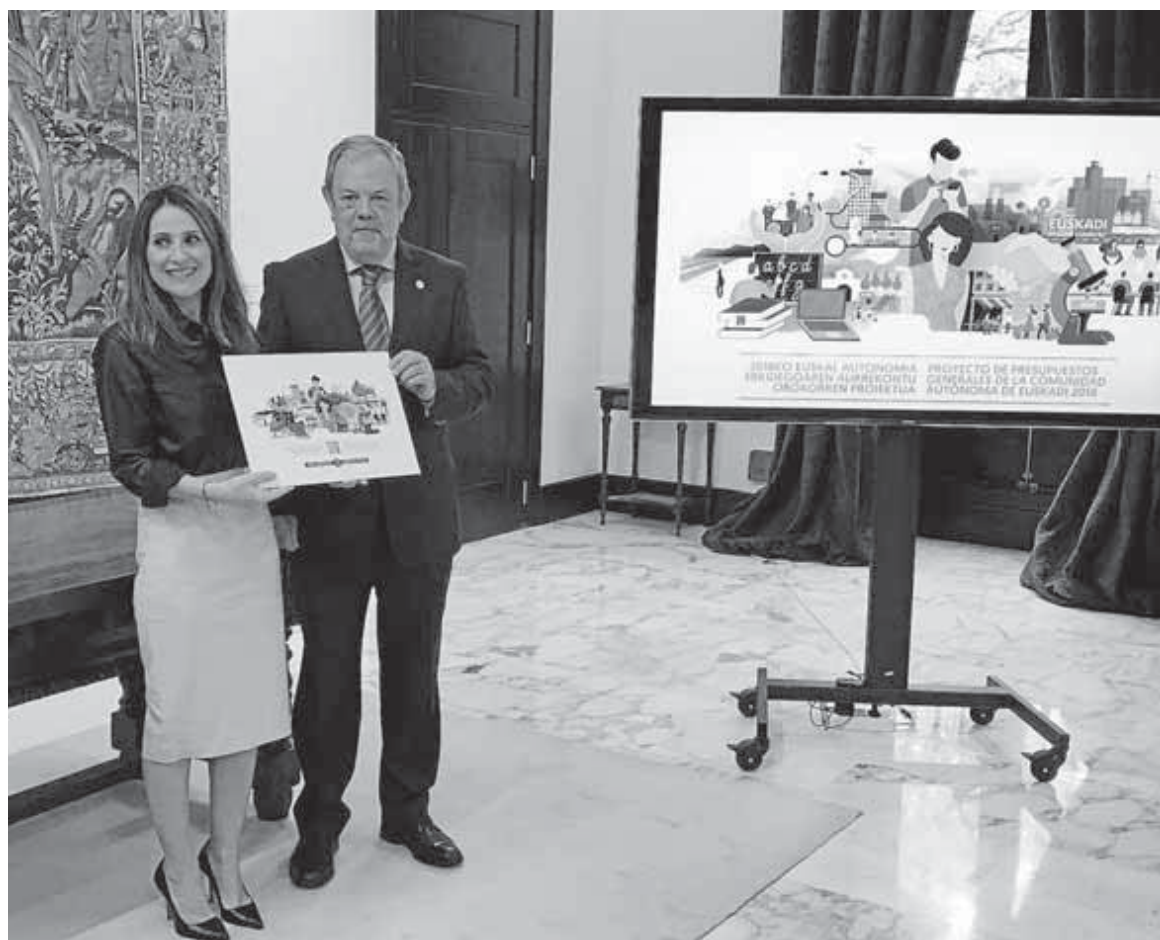
La presidenta del Parlamento, Bakartxo Tejeria, recibe el proyecto de Presupuestos de 2018 de manos del consejero Pedro Azpiazu.

LOS AUDITORES Y EL GOBIERNO VASCO CREEN QUE EL ENDEUDAMIENTO PREVISTO PARA 2018 "ES ASUMIBLE". LA REVISIÓN DE LA REFORMA FISCAL PUEDE HACER MÁS LLEVADERA LA CARGA