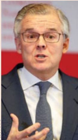
SEBASTIÁN ALBELLA Presidente de la CNMV El relevo de la CNMV fue azaroso porque el Gobierno de Rajoy estaba en funciones en 2016. Es un nombramiento por seis años no renovables.