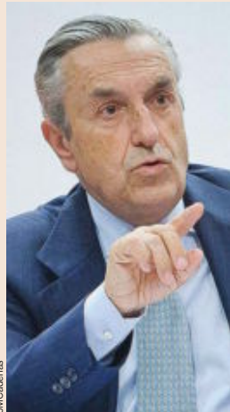
JOSÉ MARÍA MARÍN QUEMADA Presidente de la CNMC El Gobierno de Rajoy deja pendiente la escisión de la CNMC que él mismo creó. El mandato de su presidente, por seis años improrrogables, vence en 2019.