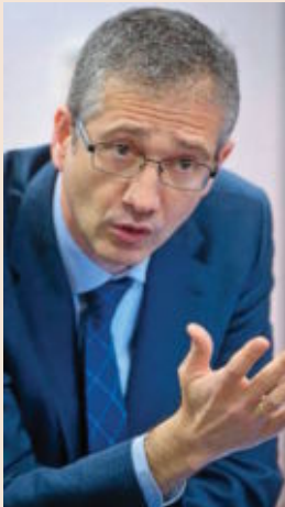
PABLO HERNÁNDEZ DE COS Gobernador del Banco de España El Gobierno de Rajoy blindó a Hernández de Cos con la publicación de su nombramiento en el BOE el jueves, cargo con una permanencia de seis años.